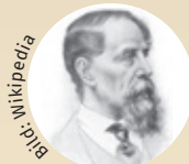
Charles Dickens englischer Schriftsteller (* 1812, † 1870)

„Und ich werde an Weihnachten nach Hause kommen. Wir alle tun das oder sollten es tun. Wir alle kommen heim oder sollten heimkommen. Für eine kurze Rast, je länger desto besser, um Ruhe aufzunehmen und zu geben.“