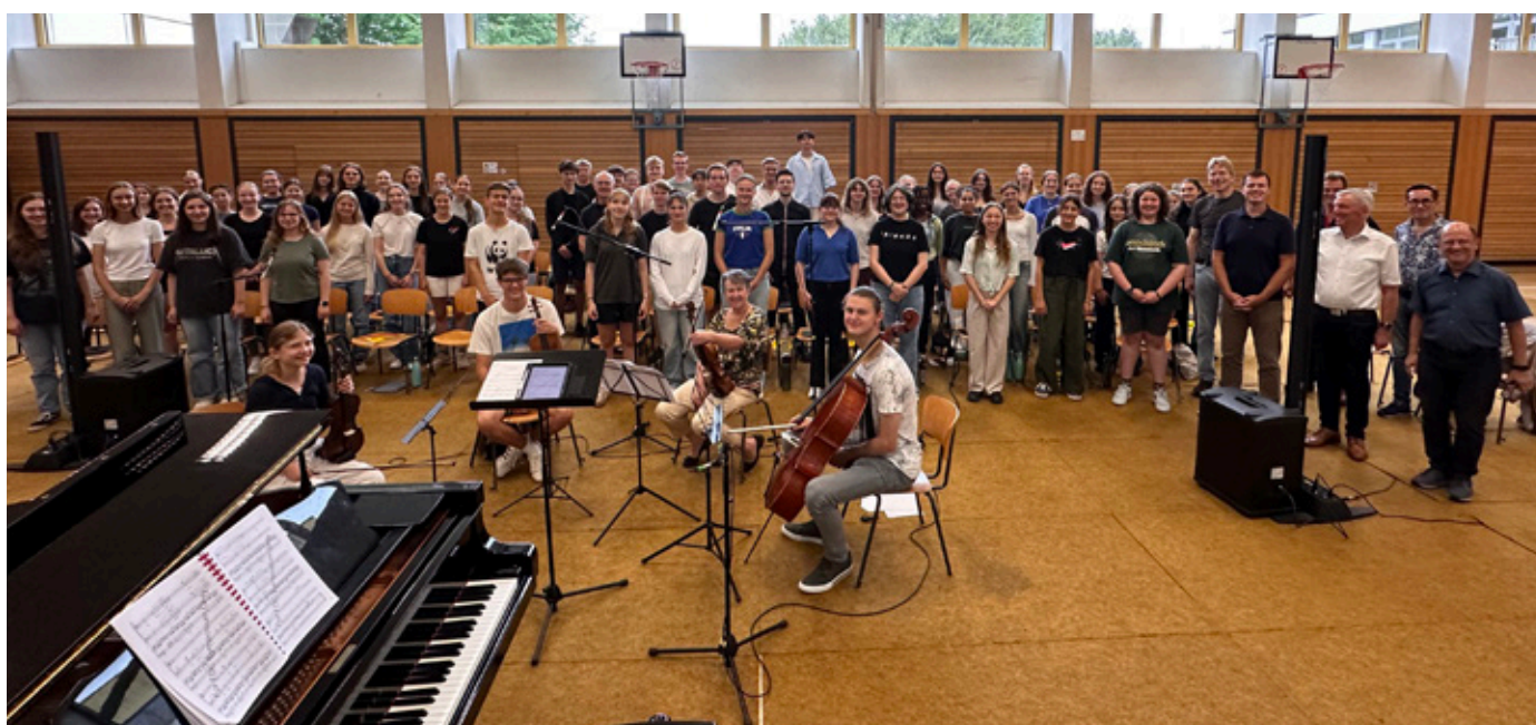
Gemeinsames Konzert aller Teilnehmenden mit den beiden internationalen Dozenten

Chorsingen und Chorleitung als eine Art Lebensgrundlage aus tiefstem Herzen kommend so zu vermitteln – dass steht ohne Frage für Offenheit und Liebe zur Musik und belegt einmal mehr den sensibilisierenden, sozialisierenden und völkerverbindenden Charakter der Chormusik!